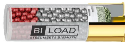
BI-LOAD 12/70 HP 36g

8 g de billes en bismuth de 3,8mm (N°2) + 32 g de billes en acier doux de 3,5mm (N°3) = 40 g de puissance pure sans plomb