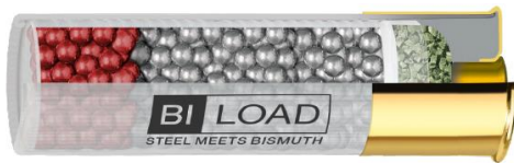
BI-LOAD 12/76 HP MAGNUM 40g

8 g de billes en bismuth de 3,8mm (N°2) + 32 g de billes en acier doux de 3,5mm (N°3) = 40 g de puissance pure sans plomb