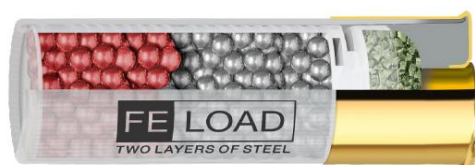
FE-LOAD 12/70 HP 36g

16g de billes en acier doux de 3,8mm (N°2) +24g de billes en acier doux de 3,3mm (N°4) =40g de puissance pure sans plomb